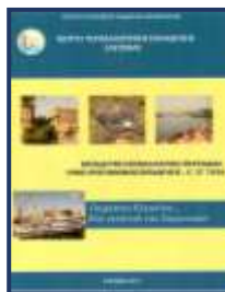
Τεύχος Α/Θμιας Εκπ/σης

http://kpe-elefs.att.sch.gr/paraktia%20a%20isbn.pdf