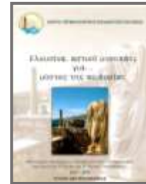
Τεύχος Β/Θμιας Εκπ/σης

http://kpe-elefs.att.sch.gr/astiko%20a%20isbn.pdf