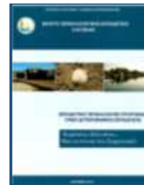
Τεύχος Β/Θμιας Εκπ/σης

http://kpe-elefs.att.sch.gr/paraktia%20a%20isbn.pdf